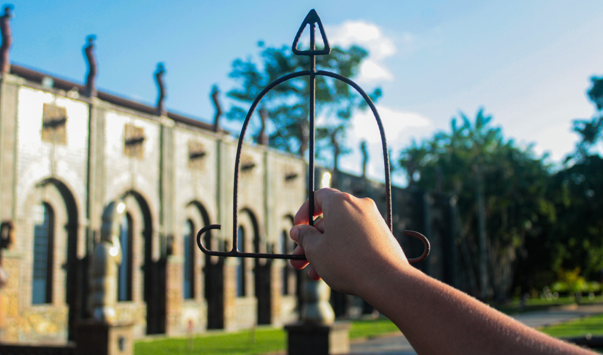
Fotos 2, 3 e 4: Tríade fotográfica – A Oficina pela ótica do Ofá de Oxóssi.